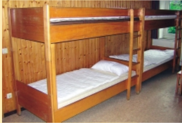
Mehrbettzimmer Haus Bethanien und Haus Sinai