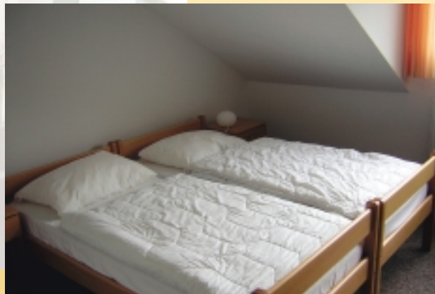
Doppelzimmer, Dusche-WC Haus Bethanien