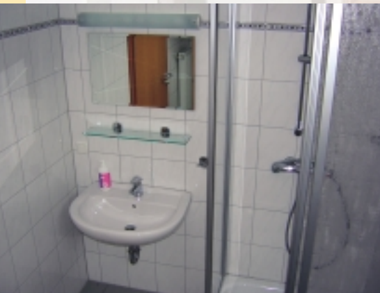
Duschbad Haus Bethanien

Im Gruppenraum können ca. 120 Personen an Tischen platz nehmen. Eine Bühne ist ebenfalls vorhanden. Im Anschluss an den Gruppenraum befindet sich eine Küche mit Spülmaschine, Großkaffeemaschine, Kühlschrank, 6 Herdplatten, Ofen, Wasserkocher und diverses Geschirr in ausreichender Menge.