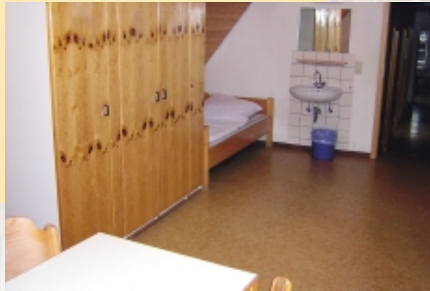
Mehrbettzimmer Haus Zion (Beispiel)